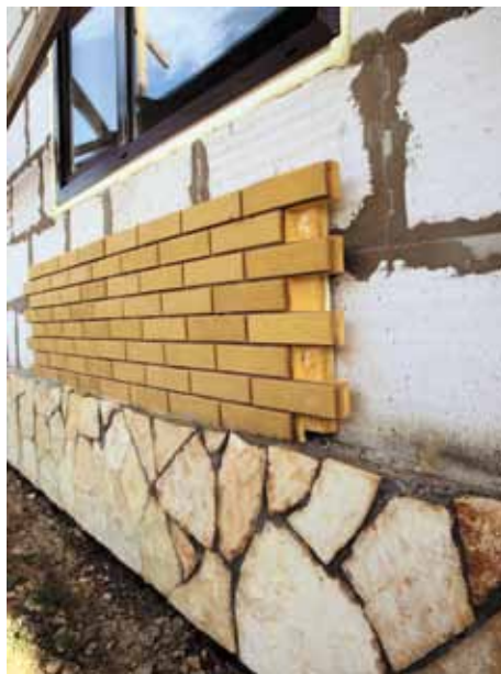
Стены и цоколи из газобетона могут отделываться практически любым облицовочным материалом.

Внутреннюю отделку желательно тоже делать паропроницаемой. Для этого важно подобрать соответствующие материалы, один из которых – та же штукатурка. Понятно, что пароизирующую отделку