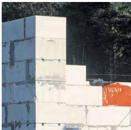
Газобетон изготавливается в виде легких крупноформатных блоков. Малый вес позволяет легко транспортировать этот строительный материал, а большой размер значительно ускоряет кладку стены.

климата доходит до 20%. После увлажнения дождем газобетон, в отличие от древесины, быстро высыхает и не коробится. В отличие от кирпича, газобетон не впитывает воду, поскольку капилляры прерываются сферическими порами. Пористая структура обеспечивает также высокую морозостойкость газобетона, поскольку вода, превращаясь в лед и увеличиваясь в объеме, имеет место для расширения, без угрозы разрыва материала.