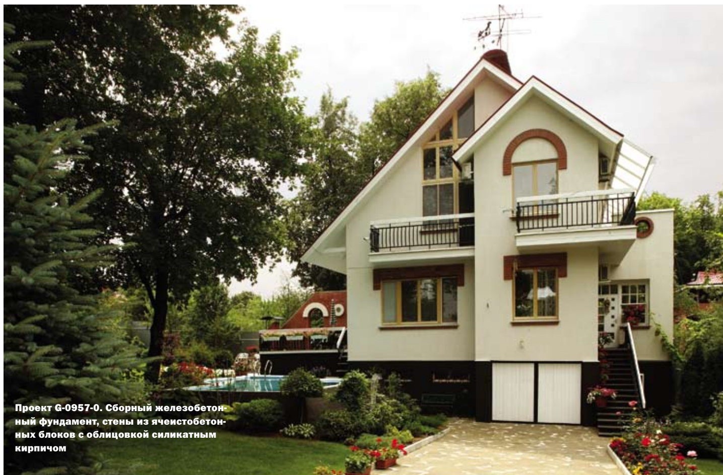
Проект G-0957-0. Сборный железобетонный фундамент, стены из ячеистобетонных блоков с облицовкой силикатным кирпичом

Керамзитобетон используется в основном для укладки заглубленных в землю частей здания – стен, подвалов и цокольных этажей. Наземные стены из этого материала требуют дополнительной теплоизоляции