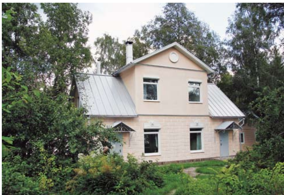
Пенобетонные стены на комбинированном фундаменте

Идеальны для ячеистобетонных стен облицовки на основе: вагонкой, сайдин-