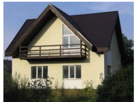
Проект F-0244-0. Стены из газобетона, отделка – лицевой керамический кирпич с расширительными швами, вагонка

Газобетон предоставляет возможность выбора практически любого отделочного материала, как внутреннего, так и наружного. Стены можно красить, штукатурить, облицовывать кирпичом, использовать навесные конструкции. При выборе материалов необходимо учитывать, что пористая структура