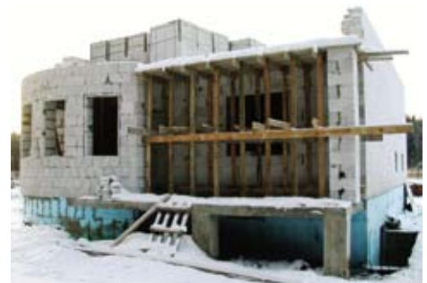
Газобетон изготавливается в промышленных условиях при помощи автоклавов, в которых поддерживаются определенное давление и температура. С-БИЛД